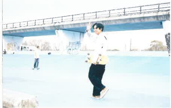
スケボーだって 思いやり楽しめる! 深北緑地 波の広場