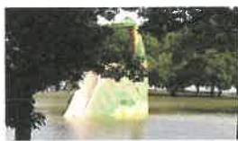
越流時の水の流れ

深北緑地は大雨時において、増水した川の水を一時貯留し、洪水による被害を防止する治水緑地です。警報サイレンが鳴ったら、速やかに公園から離れてください。